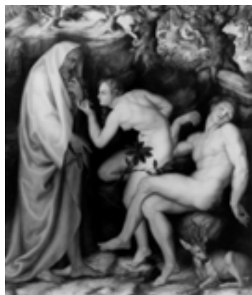
Andrea del Minga, La creazione di Eva