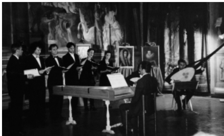
Il Complesso Barocco