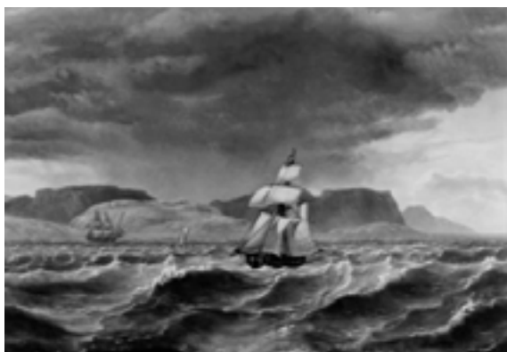
Johan Christian Dahl, Velieri presso la costa di Bergen