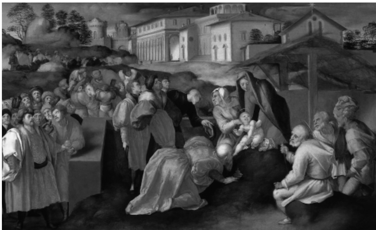
Jacopo Pontormo, Adorazione dei Magi (part.)