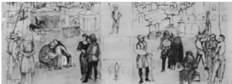
Renzo Grazzini, bozzetto

2001 Per la mostra Arti Applicate a Firenze: 1930-1960 Renzo Grazzini, Bozzetto per il concorso di piazza della Calza, 1953, china e terre colorate su carta lucida, 55x150 cm. Figura di cavaliere: particolare per l'affresco di Piazza della Calza, 1953, carboncino su carta, 200x100 cm. Restauri di Julie Guilmette