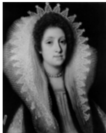
Cristofano Allori, Ritratto di Maria Maddalena d'Austria

Cristofano Allori, Ritratto di Maria Maddalena d'Austria Inv. 1890 n.4238, tela 65x50,5 cm. Restauro di Rita Alzeni