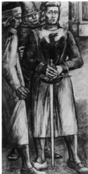
Renzo Grazzini, Figura di cavaliere

2001 Per la mostra Arti Applicate a Firenze: 1930-1960 Renzo Grazzini, Bozzetto per il concorso di piazza della Calza, 1953, china e terre colorate su carta lucida, 55x150 cm. Figura di cavaliere: particolare per l'affresco di Piazza della Calza, 1953, carboncino su carta, 200x100 cm. Restauri di Julie Guilmette