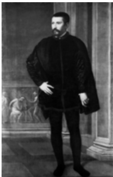
Tiziano, Ritratto di uomo in piedi