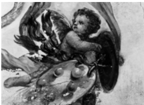
Pietro da Cortona, affresco staccato (part.)