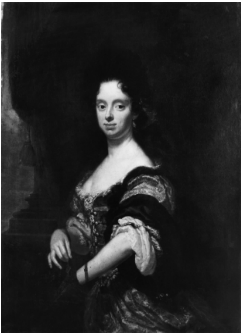
Niccolò Cassana, Ritratto di Anna Maria Luisa de' Medici

Francesco Maria, quasi coetaneo e futuro cardinale, e col fratello minore Gian Gastone, mentre Ferdinando, il fratello maggiore, si muoveva già più alto e più libero.