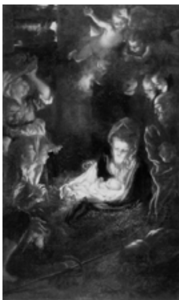
Livio Mehus, Natività