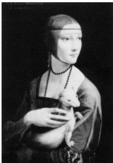
Leonardo da Vinci, La Dama con l'ermellino

Si è anche dato rilievo alla Galleria d'Arte Moderna, al nuovo allestimento e alle mostre temporanee, oltre che a due cicli di conferenze sui rapporti tra arte figurativa e letteratura, offerti da Carlo Sisi.