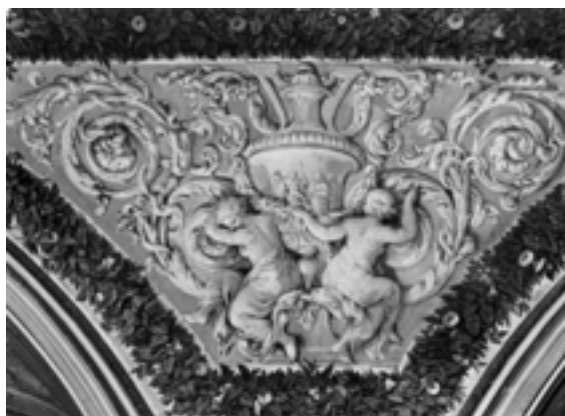
Pietro da Cortona, affresco staccato

1997 Per la mostra di Pietro da Cortona Pietro da Cortona, affreschi staccati dalla Muletta (Studio Tintori 1968/69) Revisione di Renato Castorrini