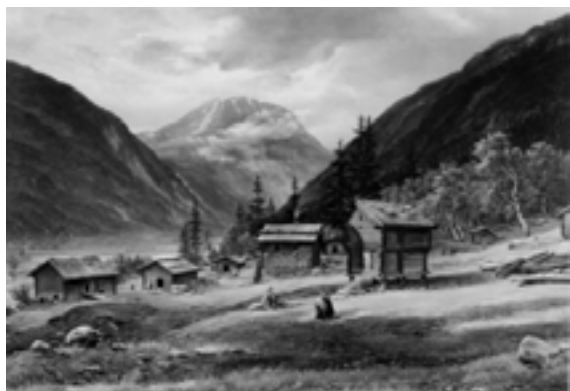
Johan Christian Dahl, La Fattoria Miland nella valle di Vestfiorden