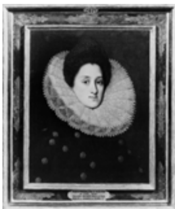
Anonimo, Ritratto di Maria Maddalena d'Austria